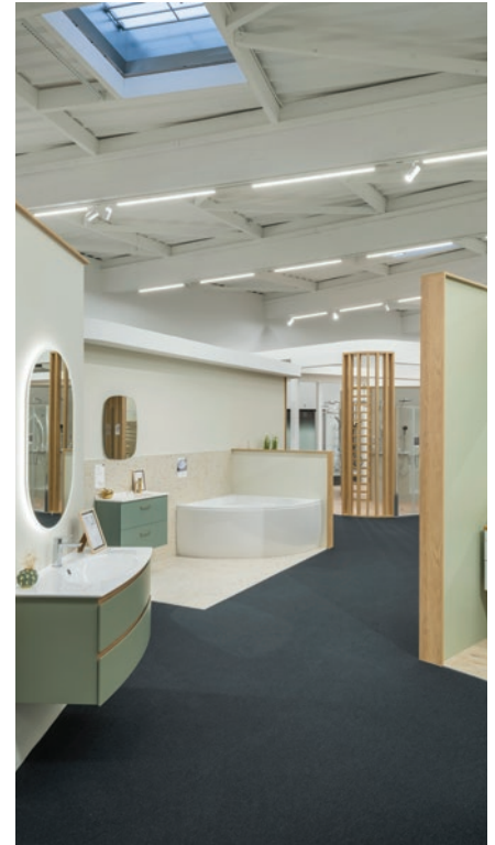
Projecteur PIXO G3 + Pixo Line

Sur le chantier, l'éclairage a été conçu en lien direct avec l'architecture existante, en s'appuyant sur le rythme et la dynamique des poutres en bois de la rotonde, ce qui a magnifié les volumes et respecté la structure originelle du bâtiment.