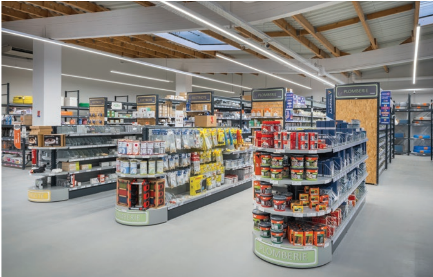
Ligne continue Isoline, fabriqué en France

Les travaux, d'une durée d'environ un an et demi, ont été pensés afin de créer deux espaces distincts mais complémentaires :